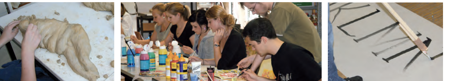
Bild- und Textrelationen in Vermittlungsfragen, Interdisziplinäres ästhetisches Lernen, Ästhetisches Verhalten von Kindern, Jugendlichen und Erwachsenen