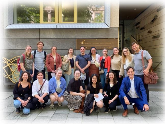
Eine Woche in Bayern Mai 2023