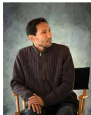
МҰХАМЕД МАМЫРБЕКОВ MUHAMED MAMYRBEKOV

2019 Қыз бен теңіз | Девушка и море | The Girl and the Sea 2014 Болу немесе болмай? | Быть или не быть? | To Be or Not to Be?