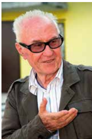
ӘЛИ ХАМРАЕВ ALI KHAMRAEV

1961–2020 жылдар аралығында режиссер ретінде 20 көркем және 40 шақты деректі және телефильмдер түсірген. Танымал фильмлері «Жетінші оқ», «Оққағар», «Кабулдағы аптап жаз».