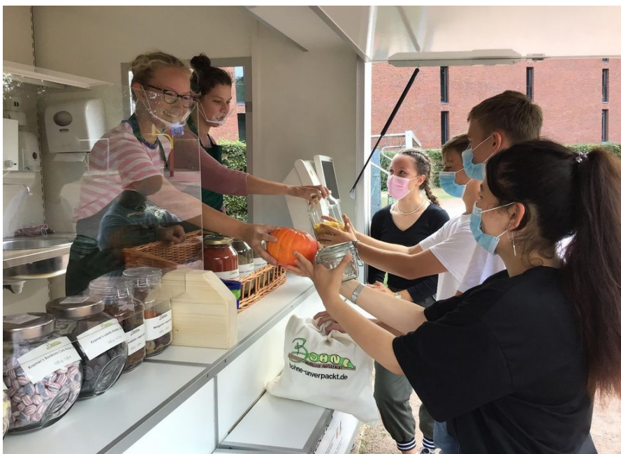
Die "Bohne" verkauft unverpackte Lebensmittel.